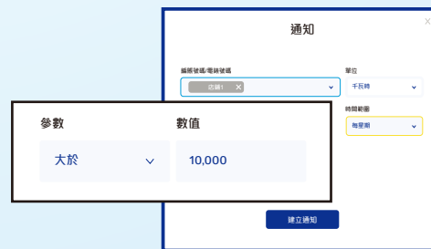
電郵提示 設定簡易