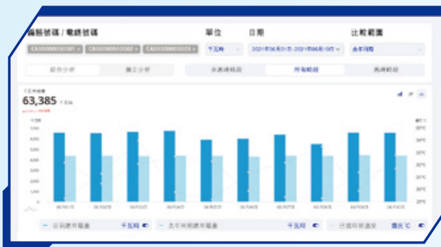
圖像顯示清晰精細