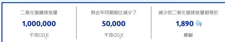
數據形象化 清晰易明